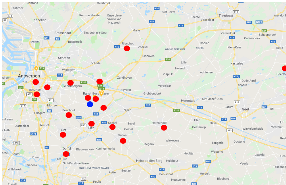
(Kaart: spreiding in 2017 van de woonplaats van klanten in Sociaal Winkelen in De Loods.)

Het aantal klanten dat in de gemeente Ranst woont nam opvallend toe en ook het aantal personen dat vanuit OCMW Ranst naar het Sociaal Winkelen werd verwezen.